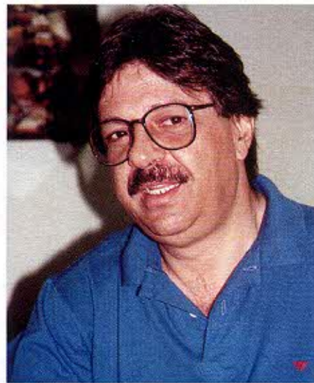
Caputo: “o máximo de conforto”